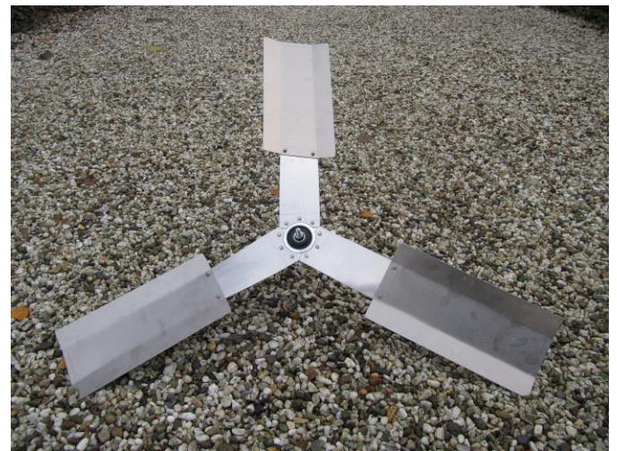
Rotor VIRYA-0.98 + Nexus naafdynamo